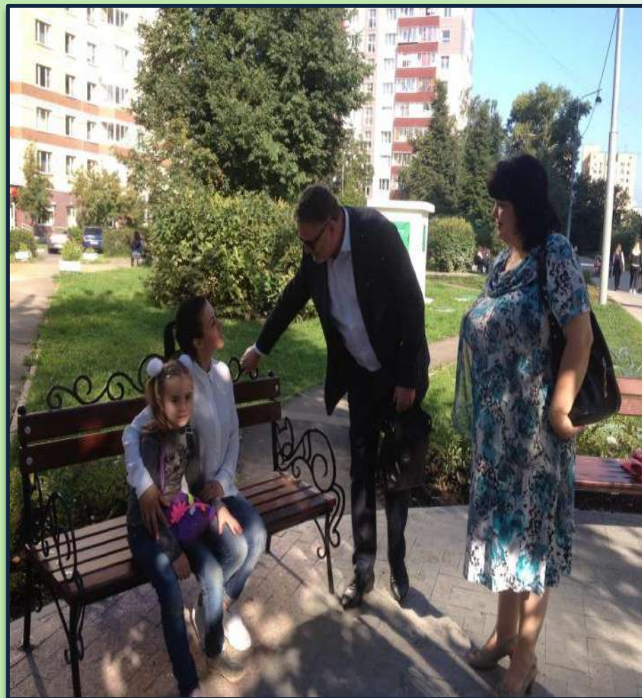
Встречи с населением во дворах района