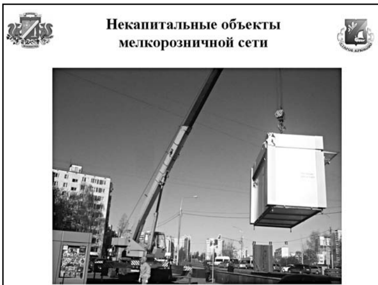
Некапитальные объекты мелкорозничной сети

Уважаемые жители! Напоминаем! Правительством Москвы установлен единый день проведения встреч глав управ районов столицы с населением – третья среда каждого месяца.