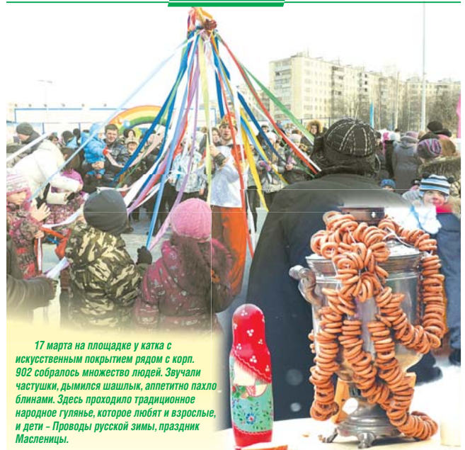
17 марта на площадке у катка с искусственным покрытием рядом с корп. 902 собралось множество людей. Звучали частушки, дымился шашлык, аппетитно пахло блинами. Здесь проходило традиционное народное гуляние, которое любят и взрослые, и дети – Проводы русской зимы, праздник Масленицы.