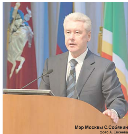
Мэр Москвы С.Собянин

высокотехнологичной промышленности, безусловно, должна сохраниться и в будущем. Зеленоград по-прежнему будет притягивать к себе высококвалифицированных специалистов. Здесь будет жить много молодых и активных людей. Они вправе рассчитывать на места в детских садах и хороших школах для своих детей, на комфорт и качество лечения в больницах и поликлиниках, на устойчивую работу общественного транспорта, на чистый воздух и разнообразные возможности для отдыха и занятий спортом. Только такой подход позволит компенсировать нашей молодежи, да и всем жителям округа объективные неудобства проживания за пределами основной территории столицы.