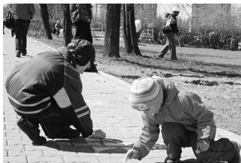
Участники конкурса «Рисунки на асфальте»

1 мая для жителей муниципального образования Старое Крюково впервые состоялся праздник «Солнечный бульвар» (у корп. 901). В программе было много интересного: жители увидели выступление творческих коллективов, файер-шоу, поучаствовали в конкурсах и викторинах. Завершился праздник торжественным запуском воздушных шаров в честь любимого города.