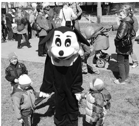
Праздничное настроение было у всех, от мала до велика

1 мая для жителей муниципального образования Старое Крюково впервые состоялся праздник «Солнечный бульвар» (у корп. 901). В программе было много интересного: жители увидели выступление творческих коллективов, файер-шоу, поучаствовали в конкурсах и викторинах. Завершился праздник торжественным запуском воздушных шаров в честь любимого города.