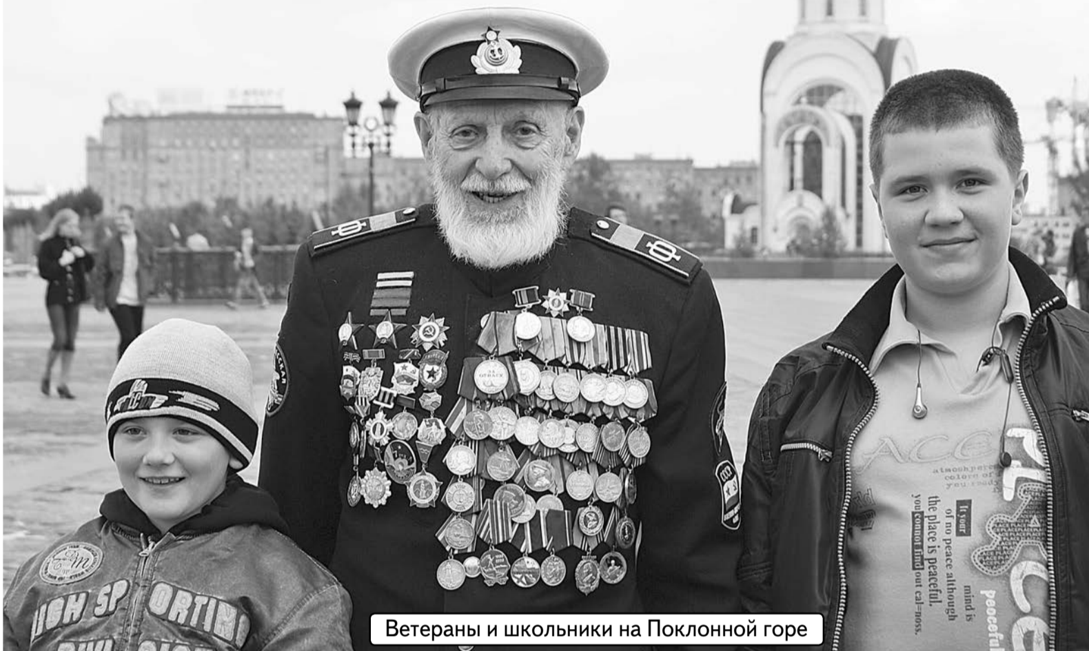
Ветераны и школьники на Поклонной горе