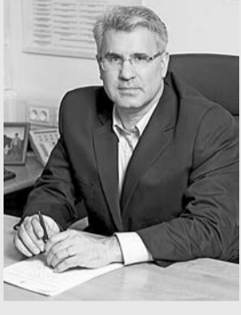
График приема населения депутатами муниципального Собрания внутригородского муниципального образования Старое Крюково в городе Москве