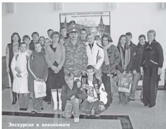
Экскурсия в военкомате

Знаете ли вы, сколько человек входит в боевую расчет пожарной команды? Как расшифровывается аббревиатура ЗАГС? Чем занимаются органы местного самоуправления в Москве? Не каждый сможет верно ответить на эти вопросы. Однако владение информацией о работе городских инфраструктур формирует правосознание человека, тем более ребенка.